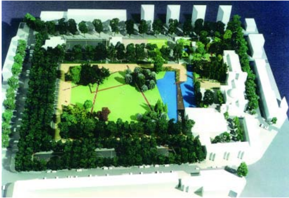
Maquette | Maqueta